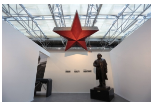
游学团_布拉格共产主义博物馆