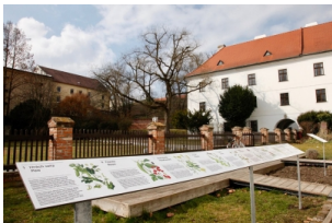
游学团_孟德尔博物馆