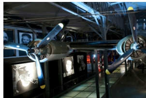
游学团_华沙起义博物馆