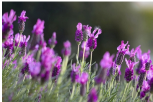
科茨沃尔德薰衣草花田

科茨沃尔德地区，游览【拜伯里】和【水上伯顿】（夏季薰衣草盛开的季节，还可游览科茨沃尔德薰衣草花田），探索英国的田园风光和特色建筑群【阿灵顿排屋】（外观）。夜宿巴斯。