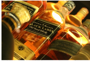
苏格兰威士忌体验中心