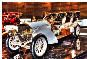
梅赛德斯-奔驰博物馆