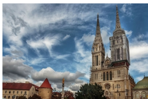
圣母升天大教堂（萨格勒布大教堂）

萨格勒布有着复杂的奥匈帝国的建筑，但是洋溢悠闲的气氛使这个城市更像典型地中海城市，令人陶醉的咖啡香、新哥特式的教堂和中世纪的古镇，又被称为小维也纳。