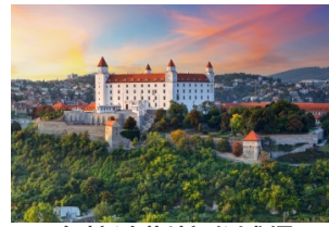
布拉迪斯拉发城堡