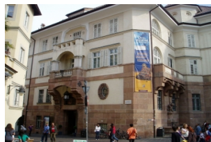
南蒂罗尔考古博物馆