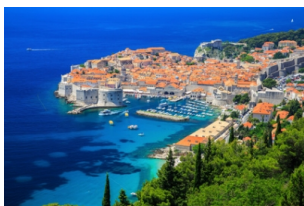
杜布罗夫尼克城墙

古老的欧诺弗利欧水池，装饰着细致的雕刻是此城的地标；在城里最主要的商店街-史特拉敦大道尽头是热闹的罗日广场，广场旁充满威尼斯风情的-史邦札宫殿及被形容为「达尔马齐亚地区最美的建筑」的总督官邸，都是杜布罗夫尼克繁荣时期的代表建筑。同时，这里的岛屿星罗棋布，林木茂盛，海水清澈，阳光充足，海岸风光旖旎。