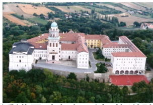
潘诺恩哈尔姆千年修道院