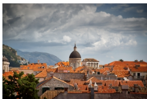
杜布罗夫尼克钟楼