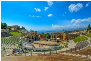
希腊露天圆形剧场