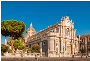
大教堂广场和圣阿加塔大教堂