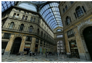
翁贝托一世拱廊街