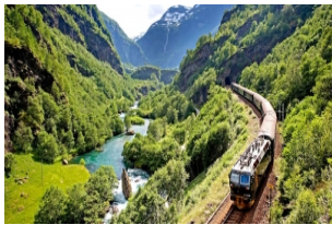
奥斯陆-卑尔根铁路

早餐后，前往火车站乘坐08:25火车前往米达尔（12:59到达），导游在米达尔接站并驱车前往弗洛姆小镇参观入住。