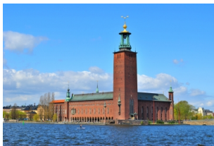
斯德哥尔摩市政厅

早餐后，约9:30抵达斯德哥尔摩码头。再次回到斯德哥尔摩，继续参观斯德哥尔摩市政厅和皇宫。下午，还可以去老城区漫步，或者参加一两个特色活动，比如买一张地铁票参观斯德哥尔摩充满艺术气息的地铁站，又或者参加一个奇特的体验项目——屋顶行走。