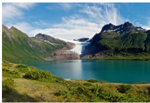
布里克斯达尔冰川