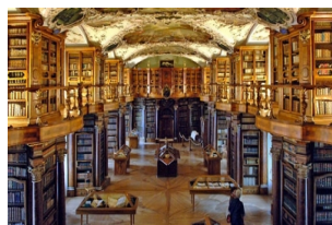
圣加伦修道院图书馆