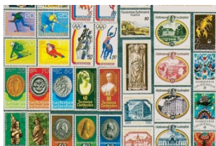
列支敦士登邮票博物馆