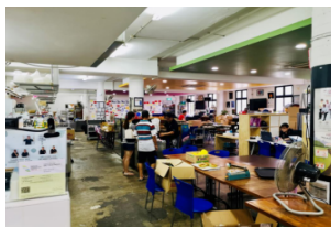
游学团_义工体验课堂