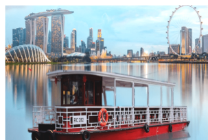
游学团_泛舟新加坡河