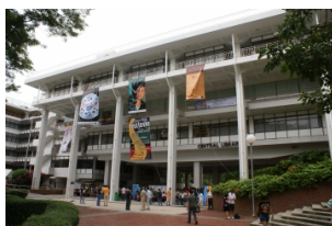
新加坡国家图书馆