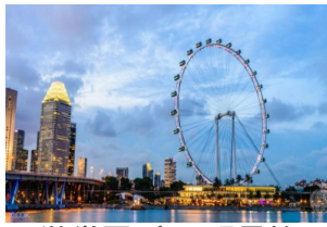
游学团_摩天观景轮