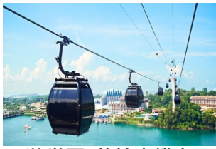
游学团_花柏山缆车