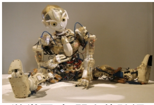
游学团_机器人体验课