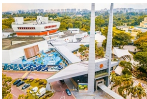
游学团_新加坡科学馆

目标：让个人开始思考和重新思考衰老的话题，并建立对老龄化社会的认识。这是一个 由老年人推动的 1 小时体验。提高人们对衰老的理解 - 包括与此主题相关的生理变化和社会 问题。