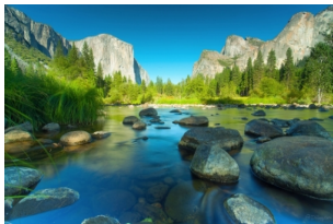
优胜美地国家公园

上午：出发前往【优胜美地国家公园】，地处加利福尼亚州东北部，曾是印第安原住民阿瓦尼奇人(Ahwahneechee)的故乡。这里有层峦叠嶂的山峰，高耸入云的岩石，有飞流直下的瀑布；这里有冷冷淙淙的溪流，百转千回的小径；这里还有数千种野生动植物，随时可能给你意外的惊喜。 下午：后来到著名的【17里湾】，这里是蒙特利半岛Monterey的精华所在，碧海蓝天沙滩礁石悬崖松柏，随处可见松鼠、海鸟和海豹，构成了17里湾迷人的画卷。