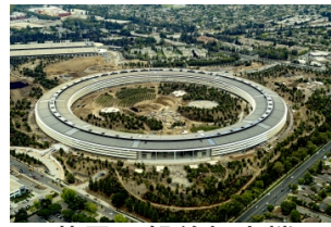
苹果飞船总部大楼