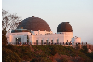
游学团_格里菲斯天文台