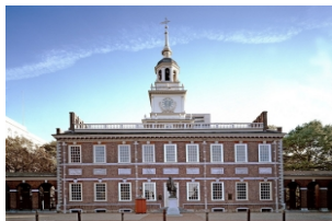
费城国家独立历史公园