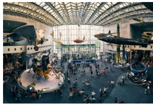
美国国家航空航天博物馆