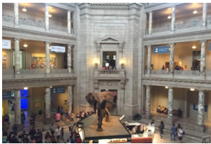
史密森尼国家自然历史博物馆