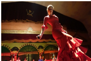
巴塞罗那弗拉明戈