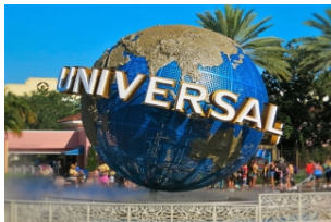
游学团_大阪环球影城

全天游玩【大阪环球影城】。园内分为纽约区、好莱坞区、旧金山区、哈利·波特的魔法世界、水世界、亲善村、环球奇境、侏罗纪公园8个区域。可以在尖叫和大笑中体验哈利波特园区的哈利波特禁忌之旅、好莱坞美梦乘车游、侏罗纪公园激流勇进、EVA或进击的巨人4D体验、终结者、回到未来等。