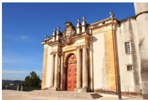
科英布拉大学巴洛克式图书馆

早餐后，前往科英布拉参观【科英布拉大学及其图书馆】，大学城分散在这座小山城里，有机会还能和穿着魔法服校服的学生合影。下午，游览度假胜地——【卡斯凯什】，探索这座海滨风情小镇，在【地狱之口】感受惊涛骇浪，并在卡斯凯什享用我们赠送的海鲜大餐。