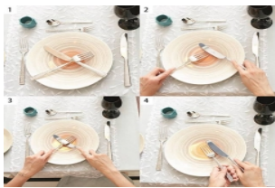
巴黎 - 法国餐具课程